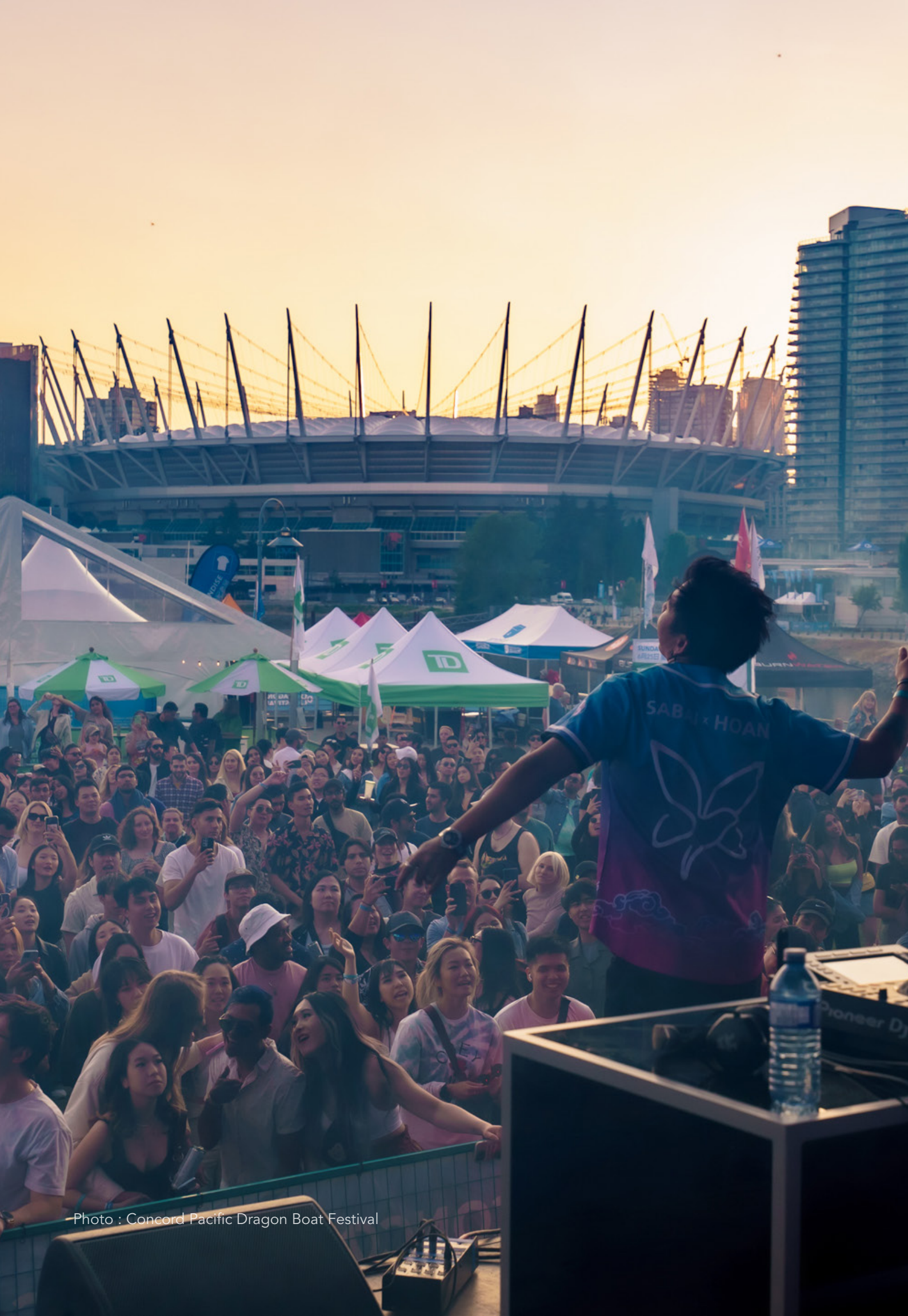
Photo : Concord Pacific Dragon Boat Festival