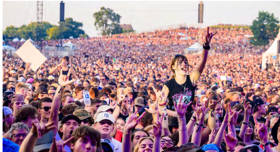
Le Festival d'été de Québec, comme plusieurs festivals de la province, continue de battre ses records d'achalandage année après année.

Par Valérie Marcoux, Le Soleil | 12 septembre 2024 à 16h41