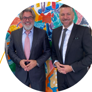
Meetings with Minister of Canadian Heritage Pablo Rodriguez and Minister of Tourism Randy Boissonnault