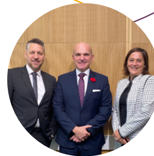
Rencontres avec le ministre du Patrimoine canadien Pablo Rodriguez et celui du Tourisme Randy Boissonnault

Meetings and ongoing collaboration with industry partners , including the Canadian Association for the Performing Arts (CAPACOA), the Canadian Live Music Association, the Tourism Industry Association of Canada (TIAC), the Canadian Chamber of Commerce, Destination Canada, Alliance de l'industrie touristique du Québec, Canadian Association of Fairs and Exhibitions (CAFE) and many others. FAME also participated in the TIAC Recovery Task Force and the Steering Committee of the Coalition of Hardest Hit Businesses .